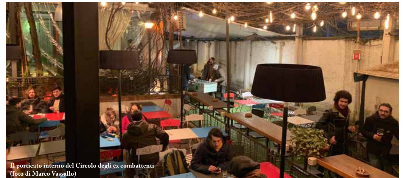
Il porticato interno del Circolo degli ex combattenti