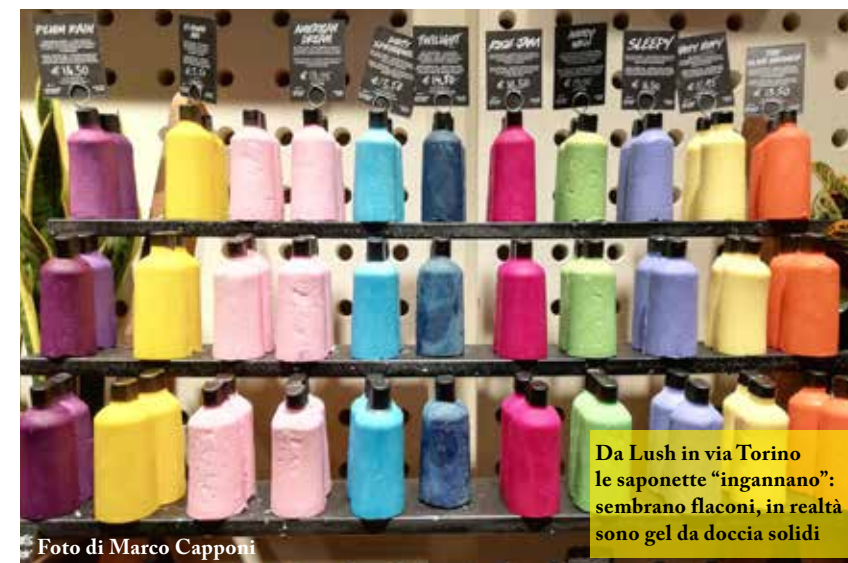
Da Lush in via Torino le saponette "ingannano": sembrano flaconi, in realtà sono gel da doccia solidi

A parte Lush, che beneficia del traffico del centro, gli altri negozi si affidano alla fidelizzazione di gente sensibile al tema ambientale. Ma il paradosso è dietro l'angolo: da Mamma natura, ad esempio, i lavori in corso lungo la strada hanno fatto diminuire la clientela, perché non c'è più posto per parcheggiare l'auto.