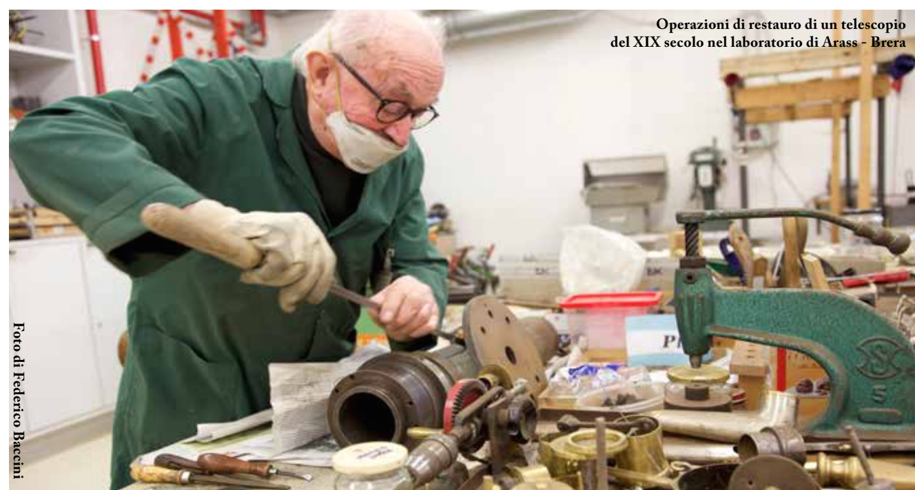
Operazioni di restauro di un telescopio del XIX secolo nel laboratorio di Arass - Brera

il loro valore», e cita il caso del globo terrestre di Willem Blaeu (fine '500). Un oggetto rarissimo, che riporta con precisione le rotte e gli alisei che hanno permesso a Cristoforo Colombo di raggiungere il Nuovo Mondo. Non solo sterili curiosità, ma un mezzo per tramandare lo sviluppo della cultura scientifica fino al presente. Niente come uno strumento scientifico analogico restaurato può spiegare i principi della scienza: il telescopio Merz-Repsold del 1878, utilizzato dall'astronomo Giovanni Schiaparelli nei suoi studi su Marte, ancora rivela con estrema chiarezza i fondamenti dell'ottica che stanno alla base dell'osservazione astronomica. «Se dimenticassimo il passato della scienza, non potremmo nemmeno capire come funzionano gli strumenti digitali, all'apparenza così semplici e intuitivi», avverte Paolucci. Una prova che la conservazione della memoria storica può rivelare un lato inaspettatamente utile. Anche a secoli di distanza.