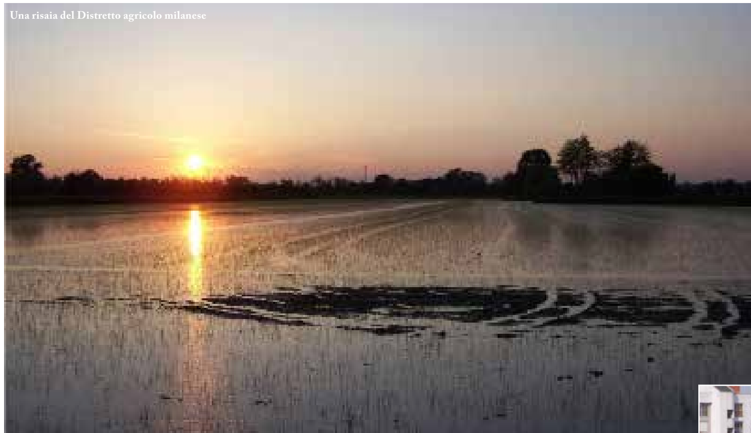
Una risaia del Distretto agricolo milanese