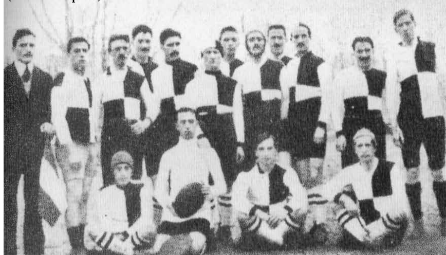
La squadra dell'Unione sportiva milanese agli inizi del '900