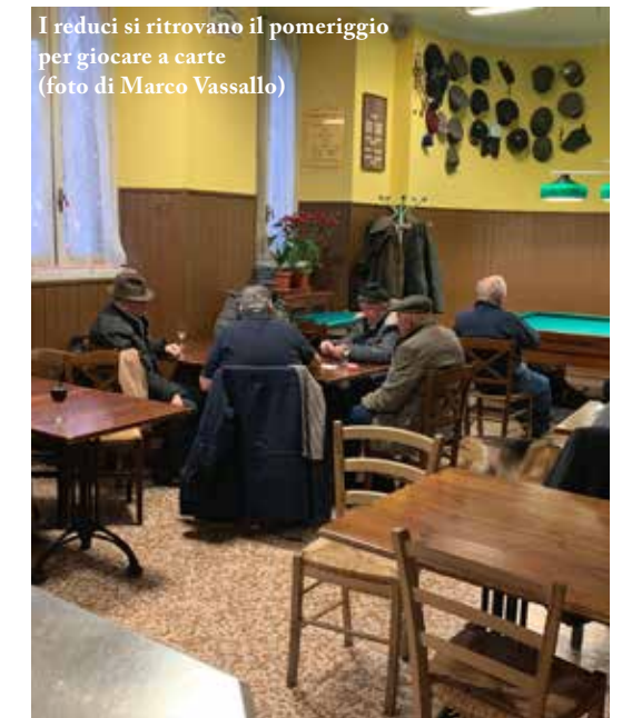
I reduci si ritrovano il pomeriggio per giocare a carte

Lo statuto dell'associazione parla chiaro: non c'è un colore politico e non si fanno discriminazioni. «Anche i cinesi di via Paolo Sarpi vengono per il risotto», afferma con fierezza il gestore. Qui lavorano persone da tutto il mondo. Insieme stanno organizzando due parate per il centenario, una per il 24 maggio l'altra per il 4 novembre. E Taccardi è sicuro. «I giovani saranno in prima fila per deporre la corona sotto al sacrario».