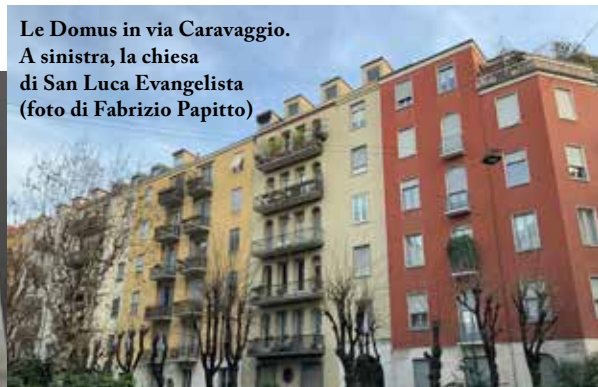
Le Domus in via Caravaggio. A sinistra, la chiesa di San Luca Evangelista

Il nostro cammino si conclude al civico 9 di via Giovanni Randaccio. Qui, isolata tra gli abeti e i rampicanti, popolata da neoclassici obelischi, timpani, dentellature e urne, fa capolino col suo bagliore lunare la prima casa progettata da Gio Ponti per la sua famiglia. Dietro le finestre accese che gettano lo sguardo lungo i binari della stazione Cadorna, sembra di vivere ancora l'ironia di quella fantasia addomesticata all'arte eppure indomita.