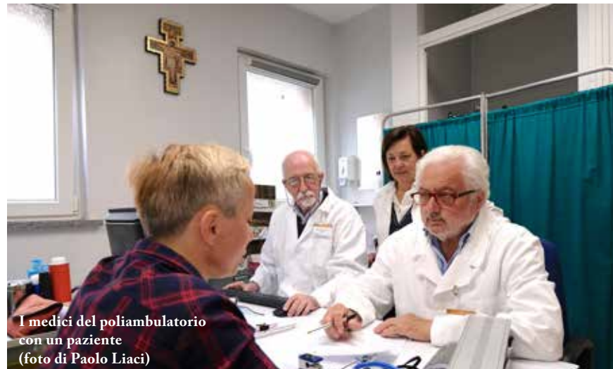
I medici del poliambulatorio con un paziente

Via della Moscova. È mattino e gennaio sta per finire. Un uomo di mezza età, intabarrato in un lungo Loden grigio, cammina a testa bassa trascinando una valigia. Non viene dall'aeroporto. Non sta andando in ufficio. Non passerà da casa a posare la valigia prima di andare al lavoro. La casa non ce l'ha più. In quella che abitava, un giudice ha stabilito che rimanesse l'ex moglie con i due figli, entrambi adolescenti. Cammina con una mano preme sul petto, l'uomo. Da giorni ha un forte dolore al torace e avrebbe bisogno di farsi visitare da un medico. Trascina la sua valigia fino a un cancello, l'ultimo, alla fine di una strada senza uscite. È quello del Poliambulatorio della Fondazione fratelli di san Francesco, in