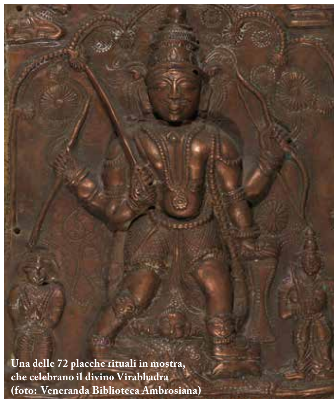
Una delle 72 placche rituali in mostra, che celebrano il divino Virabhadra

metropoli come Milano: «L'India è una dimensione del cuore e nella sua cultura risiedono quegli spunti di riflessione che permettono di trovare nella quotidianità ciò che serve a collocare meglio se stessi e gli altri nel turbinio di una grande città». In questo "induismo metropolitano" c'è, secondo la curatrice della mostra, la Milano più internazionale desiderosa di incontrare altre culture. «I milanesi sono tradizionali ma anche molto aperti e imprenditori di loro stessi. Andare incontro agli altri per instaurare un rapporto culturale e spirituale, ma anche d'affari e di scambi professionali, è quello che rende Milano il posto migliore per comprendere tutto lo spettro della cultura induista».