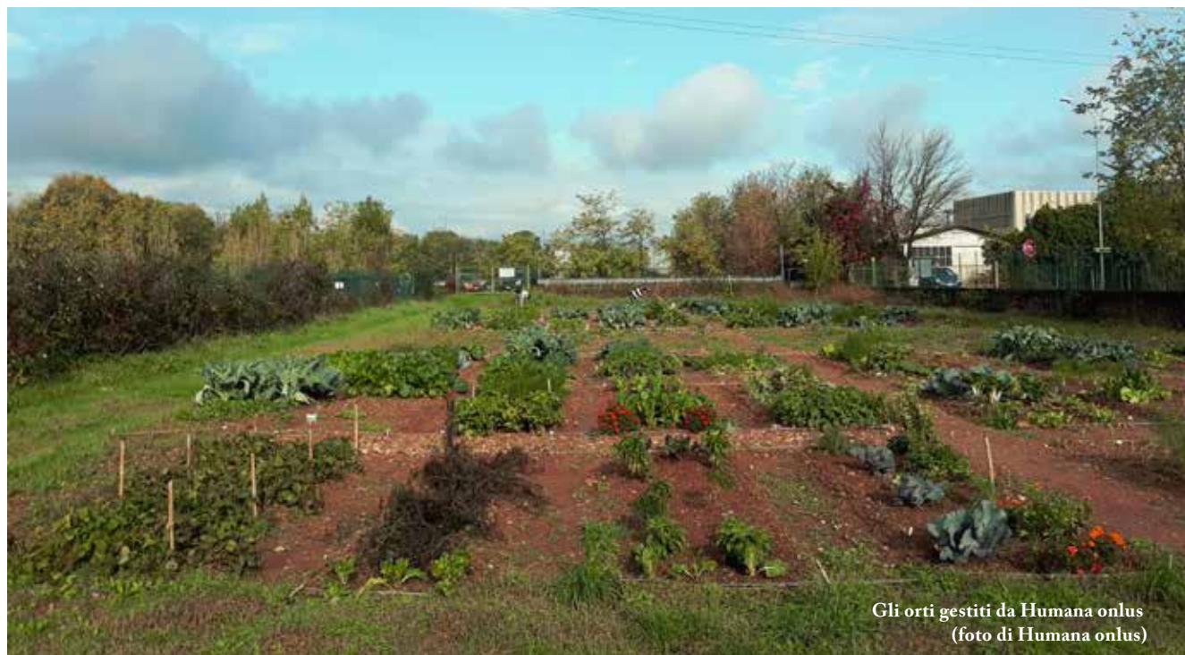
Gli orti gestiti da Humana onlus