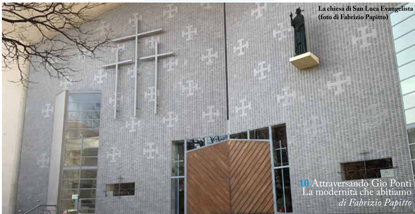
La chiesa di San Luca Evangelista

STAMPA-Loreto Print via Andrea Costa, 7 - 20131 Milano