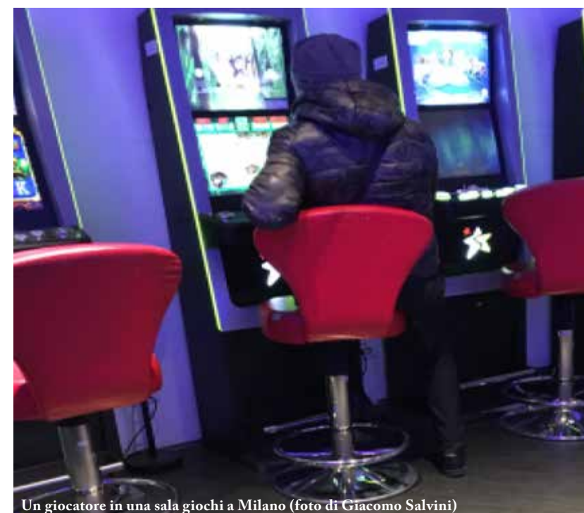
Un giocatore in una sala giochi a Milano

Allarme ludopatia: in Lombardia colpisce quattro minorenni su dieci. E i genitori non lo sanno