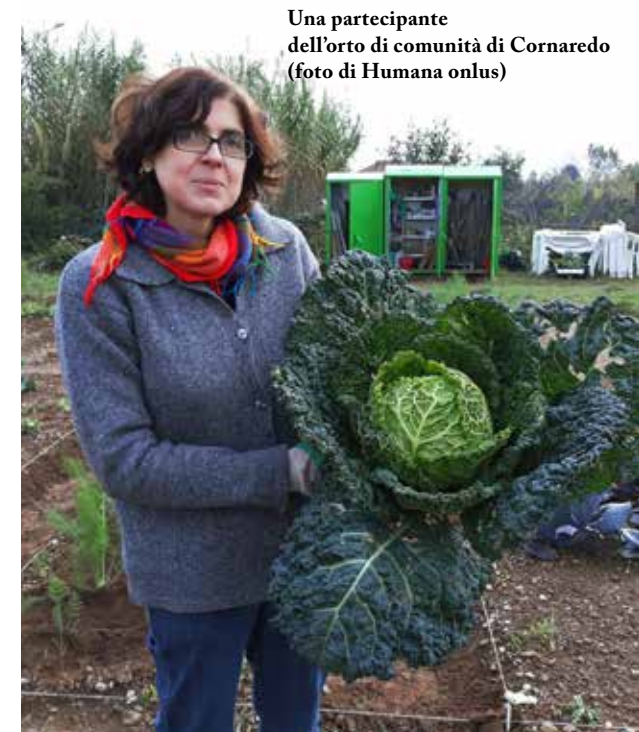
Una partecipante dell'orto di comunità di Cornaredo

I primi orti urbani a Milano sono nati nel 1974 nel Parco agricolo sud con "Il Boscoincittà", uno dei primi esempi di orti pubblici in tutta Italia. Flavia Corsano di Italia Nostra, associazione che si occupa anche della tutela dell'ambiente, è sicura: «L'orto sta rispondendo a un bisogno di coltivare la terra che è sempre meno legato all'ottenere il prodotto e sempre di più all'esperienza in sé come attività sana e di socializzazione». Con gli orti l'organizzazione umanitaria Humana onlus aiuta i cittadini in difficoltà economica. Nell'orto di comunità nato a Cornaredo l'associazione si occupa di formare i cittadini, a cui viene affidato