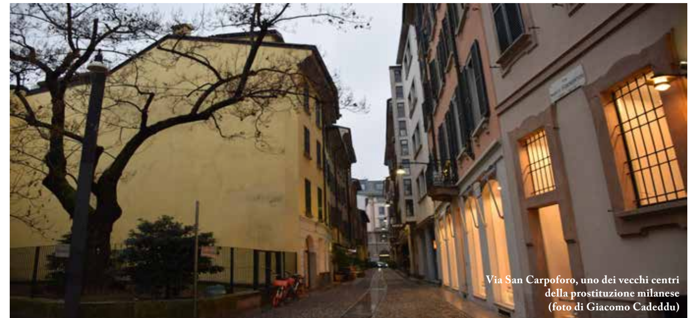
Via San Carpofo, uno dei vecchi centri della prostituzione milanese

Case chiuse e fantasmi: verità e leggende del vecchio quartiere