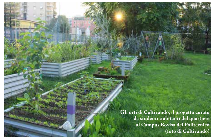
Gli orti di Coltivando, il progetto curato da studenti e abitanti del quartiere al Campus Bovisa del Politecnico

preso vita anche gli orti terapeutici: nel 2018 è stato inaugurato l'Orto di Elketto all'Ospedale Fatebenefratelli, dove i pazienti più piccoli possono trascorrere le giornate nella natura imparando a coltivare, senza sentirsi esclusi dal mondo esterno. Anche nel carcere di San Vittore è nato un giardino condiviso, con l'intenzione di ricucire la divisione tra chi è fuori e chi è dentro. Al Campus Bovisa del Politecnico di Milano è nato "Coltivando", un orto condiviso tra chi abita in zona, che se ne occupa il sabato, e gli studenti, che lo utilizzano come laboratorio a cielo aperto. «La volontà era quella di coinvolgere gli abitanti del quartiere affinché si riappropriassero degli spazi pubblici dell'università», spiega Davide Fassi, docente di Design degli ambienti e coordinatore del progetto. «Prima c'era una fabbrica e dopo l'invasione di studenti e docenti i cittadini non entravano più, volevamo ricucire il rapporto tra il luogo e il quartiere», aggiunge. Il prossimo obiettivo, per Italia Nostra, è attuare un progetto che coinvolga anche il parco di Rogoredo, ora noto come "boschetto della droga". Nel tempo di lettura di quest'articolo avremmo potuto seminare pomodori e, nell'attesa, fare qualche chiacchiera con il vicino, senza pensare solo al nostro orticello.