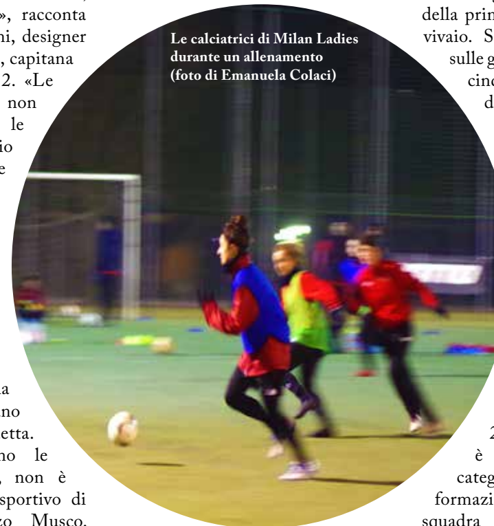
Le calciatrici di Milan Ladies durante un allenamento